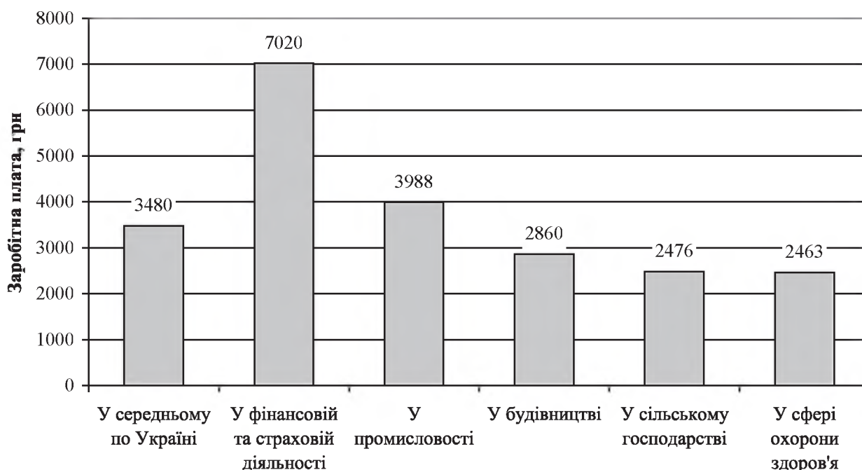
Рис. 2. Середньомісячна заробітна плата за сферами економіки України у 2014 році

Важливим аспектом є необхідність значного підвищення оплати праці в сільській місцевості. На сьогодні рівень середньомісячної заробітної плати у сільському господарстві є одним із найнижчих у країні (рис. 2, за даними [8]). Середньомісячна заробітна плата в сільському господарстві у 2014 році складала 2476 грн, що у 1,4 рази менше за показник по країні, в 1,6 рази менше, ніж у промисловості, у 2,8 рази менше, ніж у фінансовій та страховій діяльності. Частка домогосподарств у сільській місцевості, у складі яких немає працюючих осіб, складає 38,4%, а одна працююча особа – 47,0% сільських домогосподарств [6]. Коефіцієнт економічного навантаження на працюючого члена сільського домогосподарства (відношення загальної кількості його членів до числа працюючих) дорівнює 2,63 (у середньому по Україні – 2,27, у міських домогосподарствах – 2,11).